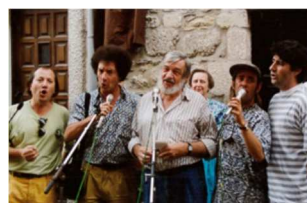
> "Chanson plus bifluorée", avec Jean Pierre Chabrol.